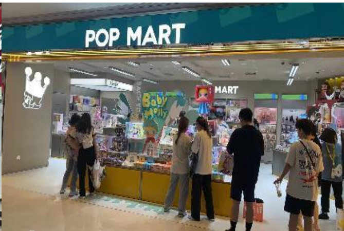
แบบเต็มถุงเลย

*กรณีที่ไม่สามารถเดินทางไป ถนนคนเดินหวงซิงลู่ ได้ เนื่องจากตลาดปิด จราจรติดขัดรถหนาแน่น หรือเหตุฉุกเฉินใดๆ ก็ตาม ทางบริษัทฯ ขอสงวนสิทธิ์เปลี่ยนนำทุกท่านไป ละลายเงินหยวนช้อปปิ้งที่ OUTLET BAILIAN OUTLET สวรรค์สำหรับนักช้อปปิ้งตัวยงมีของหลากหลายเช่น เสื้อผ้า รองเท้า กระเป๋า สินค้าแฟชั่นต่างๆ จากแบรนด์ชั้นนำ ของดีราคาสบายกระเป๋า ประหยัดได้สูงสุด 30 – 70% เลยก็ว่าได้ แทนโดยไม่แจ้งให้ทราบล่วงหน้าทุกกรณี